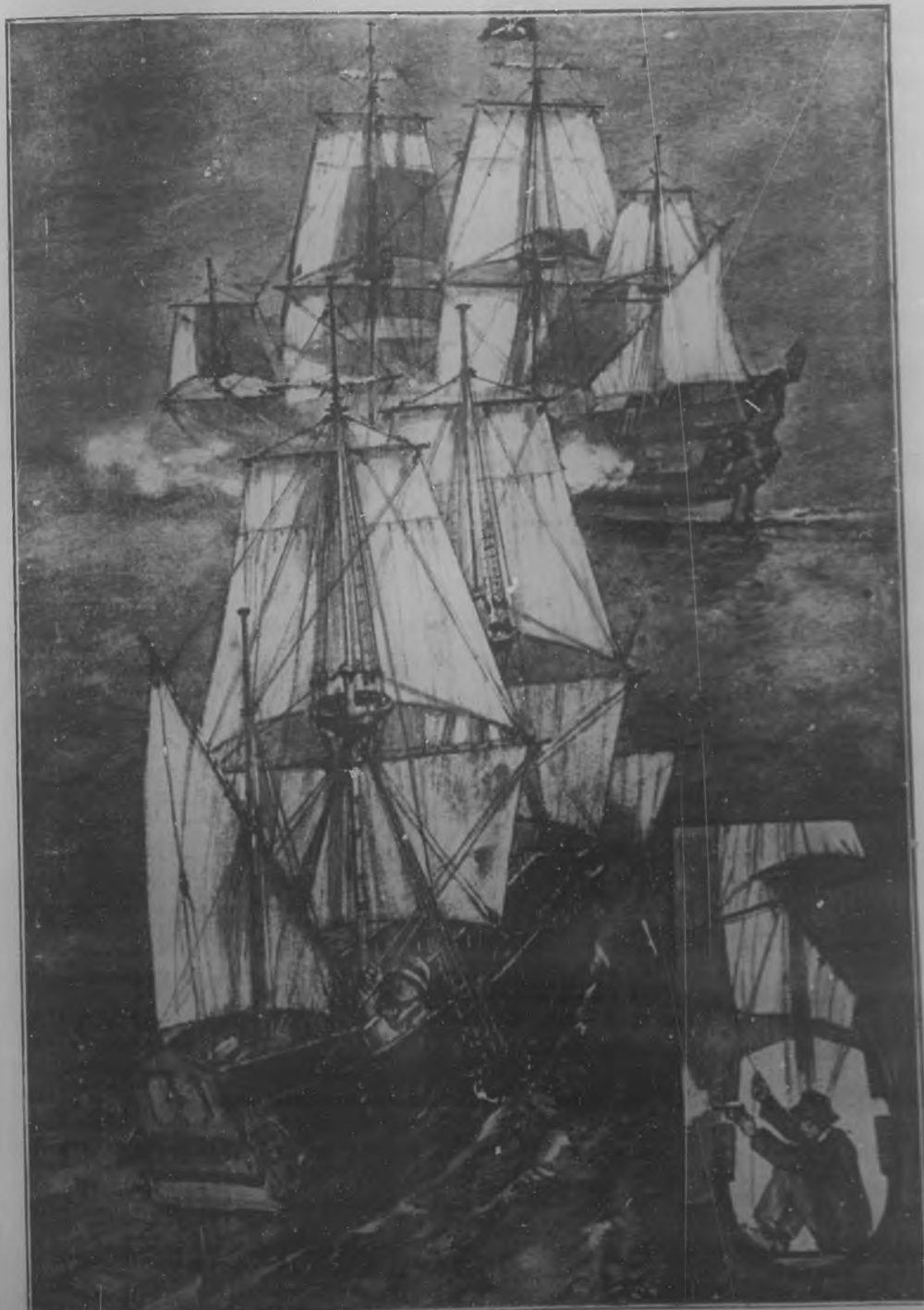
LAS FICCIONES DE LA CINEMATOGRAFIA.—Navios en miniatura tripulados por dos o tres personas y artillos con revólvers, que hacen el oficio de cañones, que utilizan algunas compañías cinematográficas de Inglaterra para simular combates navales.

Relación, Administración y Talleres: Edición de BOHEMIA, Trocadero número 59, 51 y 53.—Teléfono: Dirección, M-1362; Administración, A-1568; Relación, M-1368.