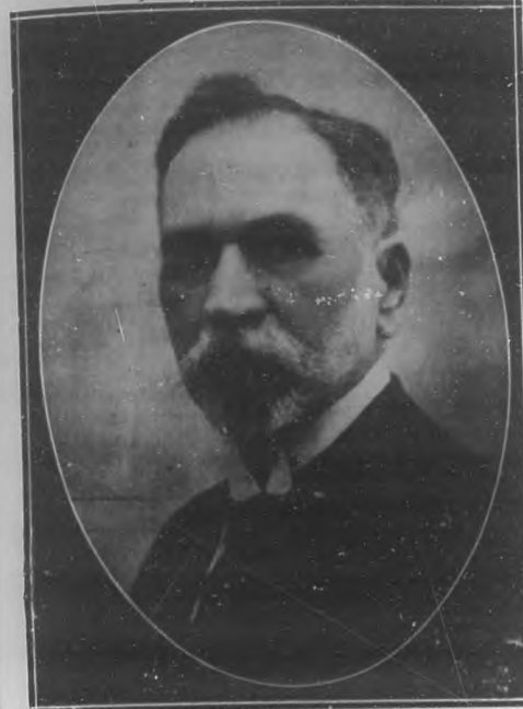
GRAL. EMILIO NUREZ

ta, que durante toda su vida fué modelo de altas virtudes, ha hecho que este fallecimiento haya sido muy sentido. La Parca que nada respeta, al tronchar esta vida deja en el ma-