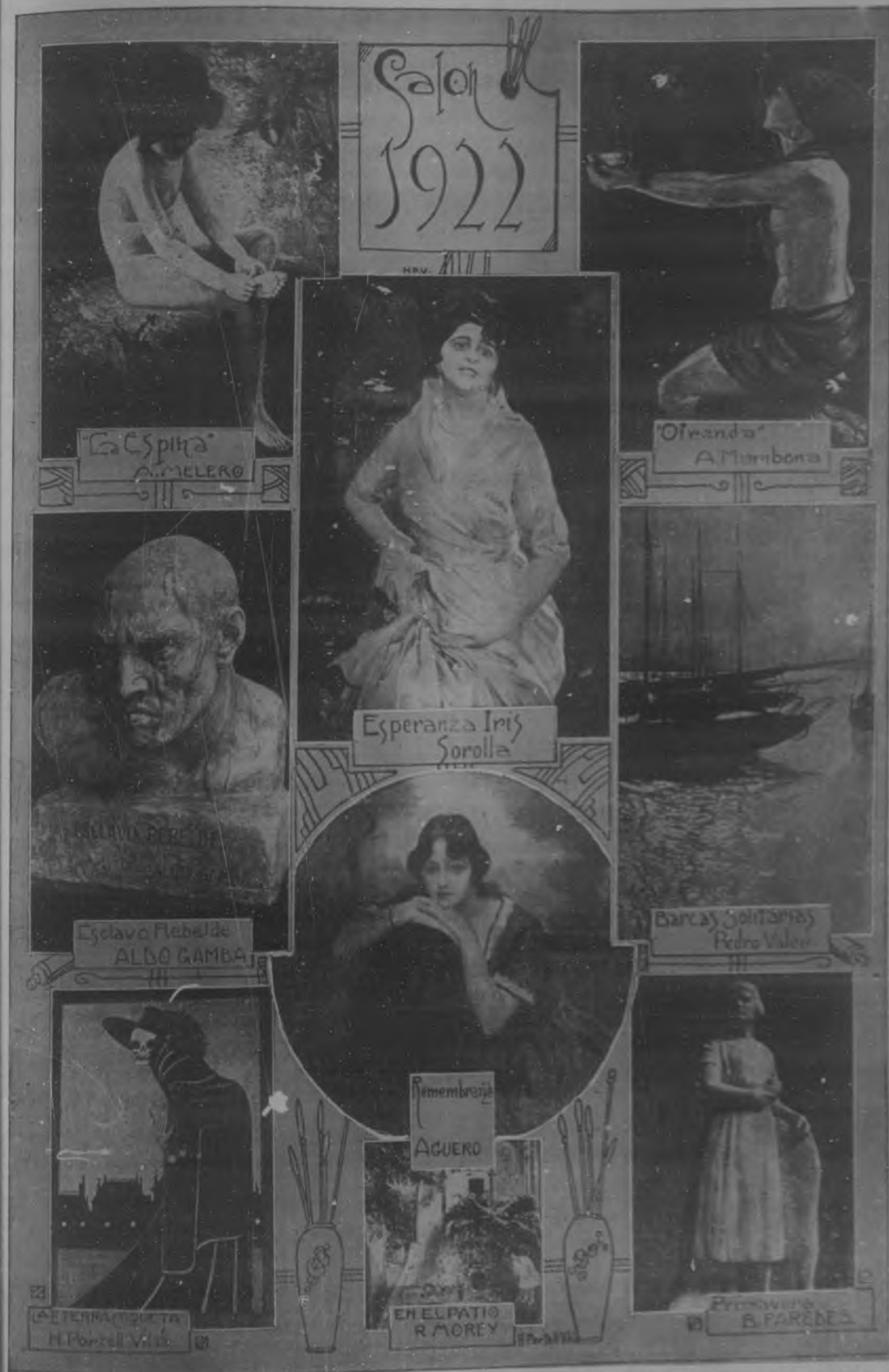
Algunas de las mejores obras expuestas este año en el Salón de Bellas Artes, que actualmente se está celebrando en los salones de la Sociedad de Pintores y Escultores.