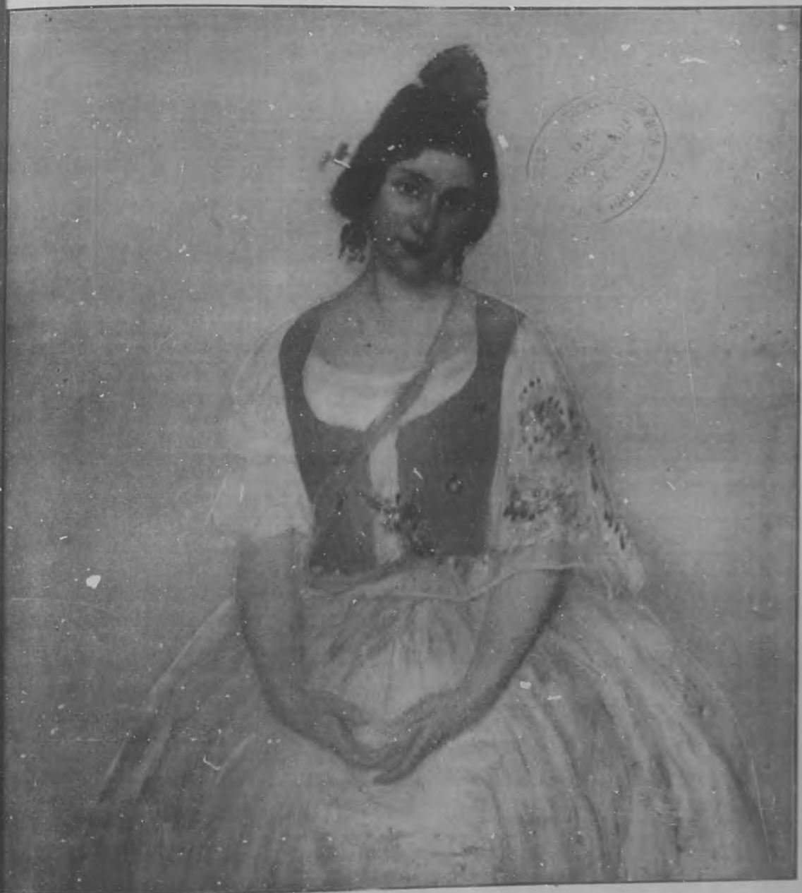
ROSA DE TE Oleo por Pinazo Martínez.