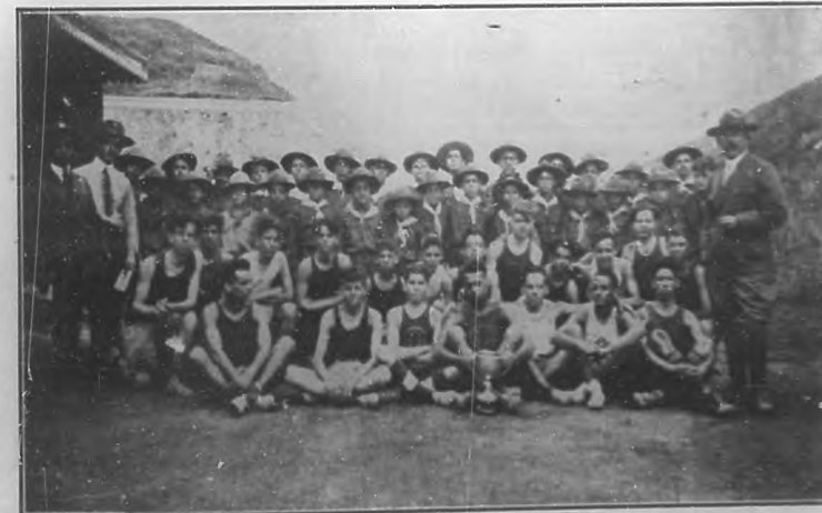
Los "exploradores" de Cuba en el "Field day" celebrado en la Batería Núm. 3, el domingo 23 del pasado mes.

Están tramitándose los expedientes de estos varios comités locales, cuyas actas de constitución iremos publicando tan pronto recibamos la sanción del Comité Ejecutivo Nacional.