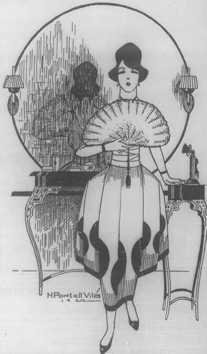
La mujer es como la encarnación suprema de la belleza en la tierra.