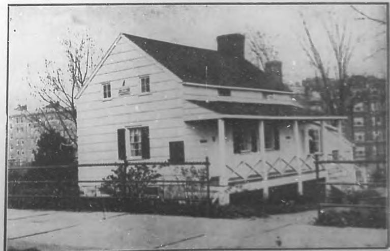
La casa de Poe, en cuyo ático escribí la inmortal elegía de "El Cuervo".

La fatalidad del cantor de Leonora es post-umbra, y no sólo leió a los espíritus vivos sino también a las cosas muertas!