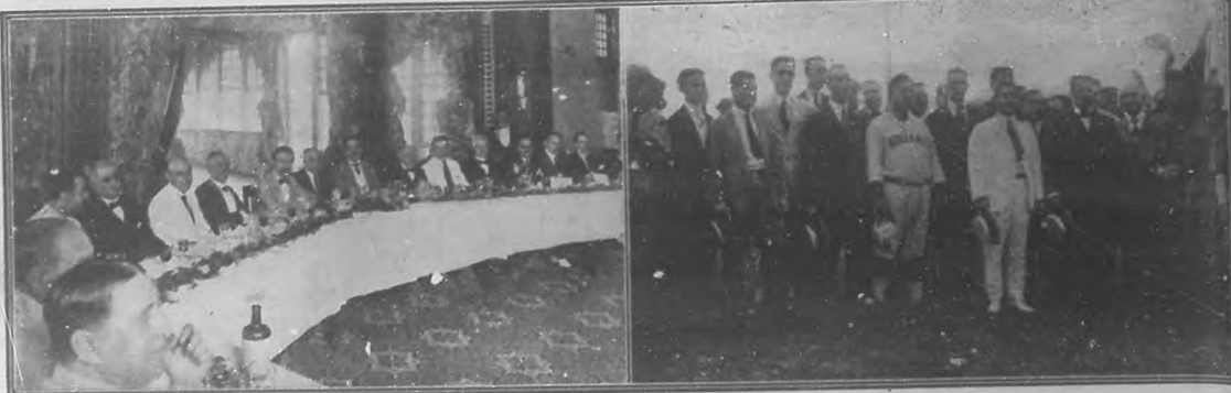
A la izquierda:—Presidencia del homenaje ofrecido en el hotel "P Laza" al Sr. Cónsul de España, por la sociedad regionales españolas. A la derecha:—Un aspecto del acto de inauguración del Campeonato Nacional de Amateurs en "Almendares Park".

Después de una larga y angustiosa agonía acaba de rendir su alma a Dios el general Emilio Núñez, uno de esos patriotas que a la hora del sacrificio supo darlo todo por Cuba.